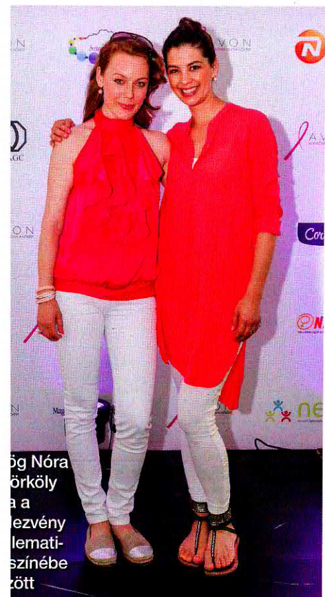
...g Nóra ...örköly ...a ...ezvény ...lemati- ...színebe ...zött